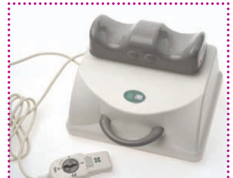
Das original Sun Ancon Chi-Gerät

Unser Test zeigte: Dieses Maschinen tut dem Körper tatsächlich gut. Und es hält, was es verspricht: Nach der Anwendung, man startet mit 5 Minuten und steigert sich im Laufe der Tage auf 20 Minuten, kribbelt,